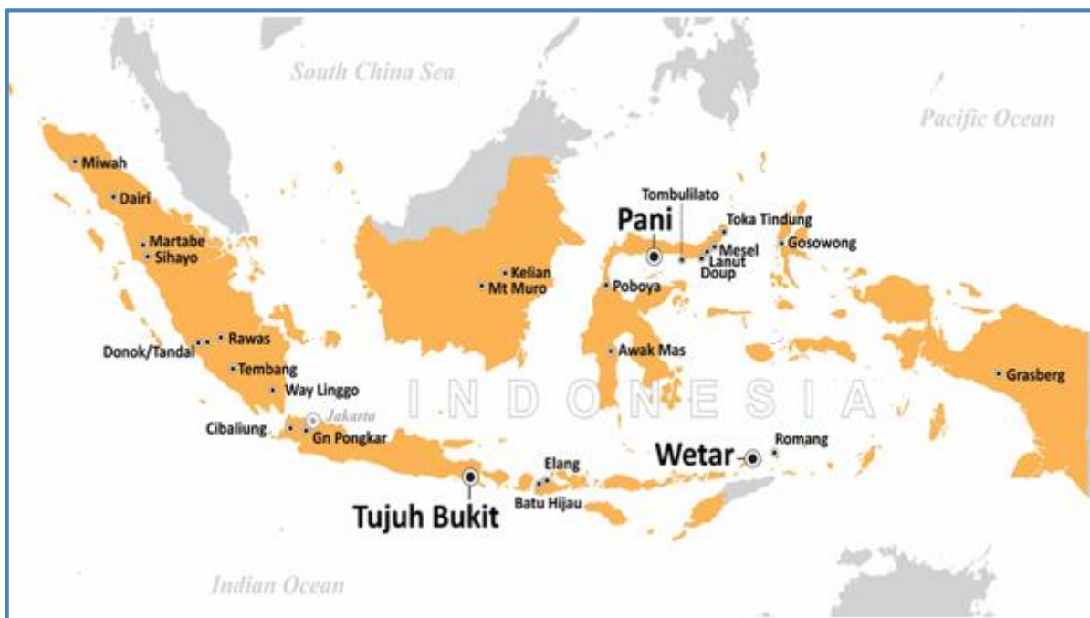
Gambar 1: Daerah Kegiatan Eksplorasi yang Dilakukan oleh Merdeka di Indonesia

Adapun total biaya yang dikeluarkan untuk mendukung seluruh kegiatan eksplorasi yang dilakukan Merdeka di Indonesia selama bulan Oktober 2020 adalah sebesar Rp16,64 miliar.