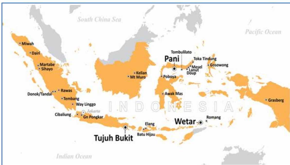
Gambar 1: Daerah Kegiatan Eksplorasi yang Dilakukan oleh Merdeka di Indonesia

Adapun total biaya yang dikeluarkan untuk mendukung seluruh kegiatan eksplorasi yang dilakukan Merdeka di Indonesia selama bulan Oktober 2019 adalah sebesar Rp37 miliar.